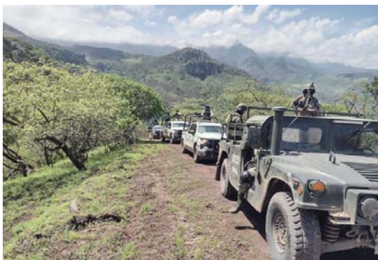
Operativo policial protege a pobladores