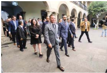
MERIDIANO | Jalisco

Durante la sesión solemne, el gobernador Pablo Lemus recibió la Medalla al Mérito Judicial Mariano Otero Mestas, además de que se dio el arranque oficial del canal público Judicial TV Jalisco