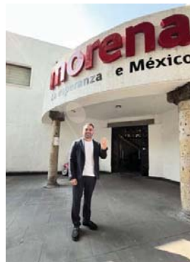
social que caracteriza a Morena.