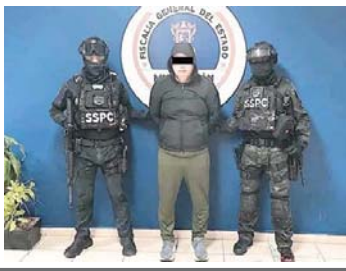
En el Buen Fin