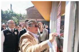
MERIDIANO | Jalisco

En la Vigésima Tercera Sesión Ordinaria de la Mesa de Seguridad de Alto Nivel para el Mapeo Territorial de la Violencia en Razón de Género, autoridades estatales y municipales revisaron información estadística, así como avances en mecanismos de protección