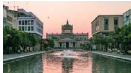
MERIDIANO | Jalisco

Con 24 categorías que abarcan gastronomía, turismo cultural, hospedaje, aventura, bienestar y personalidades del sector, los galardones surgen del voto abierto de las audiencias de México Desconocido