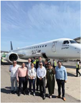
MERIDIANO | Puerto Vallarta

La aerolínea canadiense refuerza la conectividad con el país norteamericano y consolida la relación entre ambos destinos turísticos