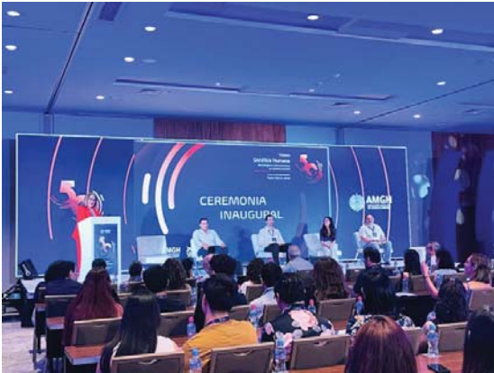
MERIDIANO | Puerto Vallarta

El municipio fue sede del 50° Congreso Nacional y del g° Congreso Latinoamericano de Genética Humana, donde se analizaron avances científicos y retos actuales en el estudio del ADN