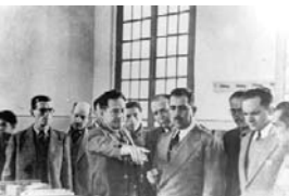
Fuentes: Gaceta Politécnica No. 1687 año 2022/ ipn.mx CENDI "Laura Pérez de Bátiz" / El Cronista Politécnico NÚM. 53 año 2012

Tras el fallecimiento de Juan de Dios Bátiz, el