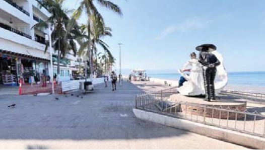
MERIDIANO | Puerto Vallarta

El presidente de Puerto Vallarta recorrió las obras que se realizan en la segunda etapa del malecón, así como de la avenida México