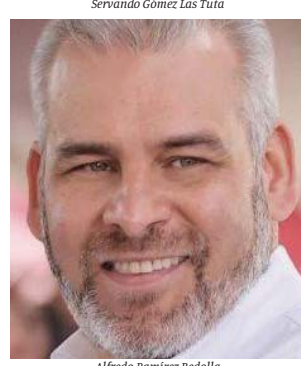
Alfredo Ramírez Bedolla

El héroe de carne y hueso La tragedia de Uruapan es un llamado a la reflexión y a la acción. No podemos seguir permitiendo que la violencia y la impunidad se apoderen de nuestro país. Es necesario fortalecer las instituciones, combatir la corrupción y promover una cultura de legalidad y respeto a los derechos humanos. El legado de Carlos Manzo, el héroe que despertó al tigre, debe ser un faro que ilumine el camino hacia un futuro de paz y justicia para todos los mexicanos.