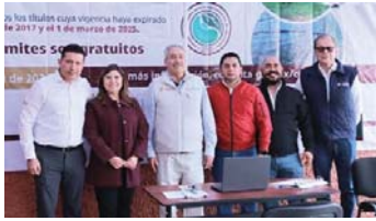
MERIDIANO | Ciudad de México

El Gobierno de México ha instalado 100 módulos para que los pequeños productores agrícolas actualicen o regularicen sus títulos de concesión en los próximos seis meses que tienen como plazo