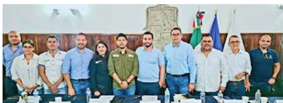
En Puerto Vallarta