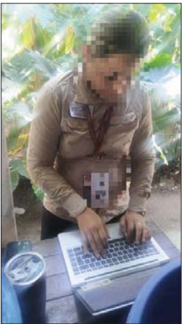
Inspectora de la PROFEPA puso en buen resguardo la tortuga Casquito de Vallarta