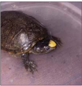
La tortuga Casquito de Vallarta, rescatada