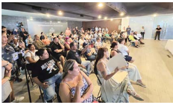
Se compromete Seapal