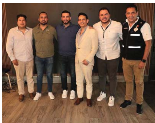
Junto al gobierno vallartenses

Se hizo una visita de supervisión al albergue Vida Nueva y se revisaron algunos espacios que pueden ser adecuados para la construcción del nuevo Centro Regional de Atención al Autismo y Discapacidad Intelectual en esta zona.